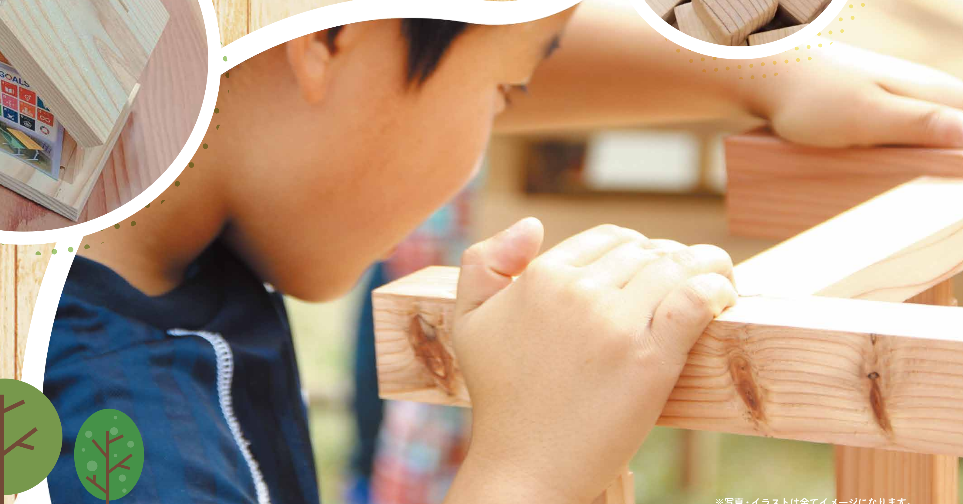
※写真・イラストは全てイメージになります。